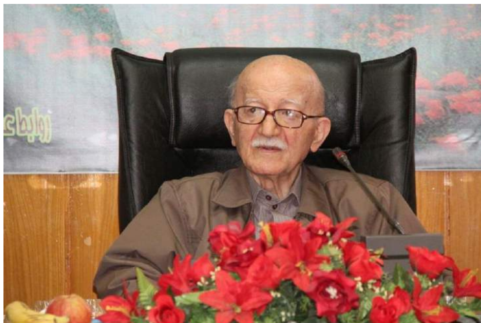
جلسه هم اندیشی نجات محیط زیست و آب و جنگل های مازندران